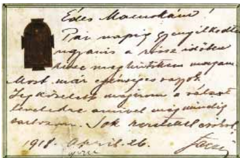
Tábori postai levelezőlapok: Szüleinek és nővérének („Mamó”)