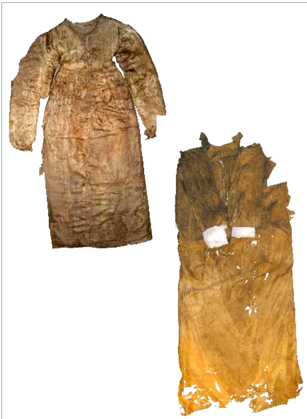
A leletek tisztítás és konzerválás után.