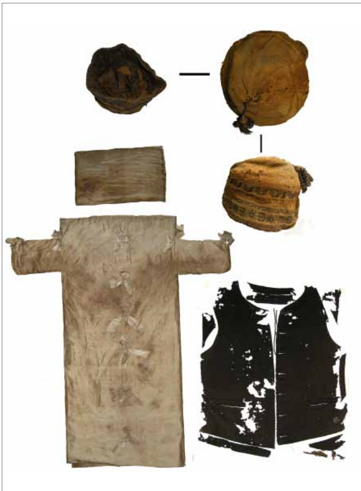
A leletek tisztítás és konzerválás után.